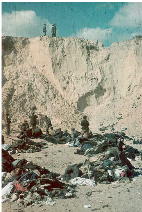
Afdruk van de originele foto van het 'Pad van Kleren' na de massamoord in Babi Yar, gemaakt in oktober 1941.